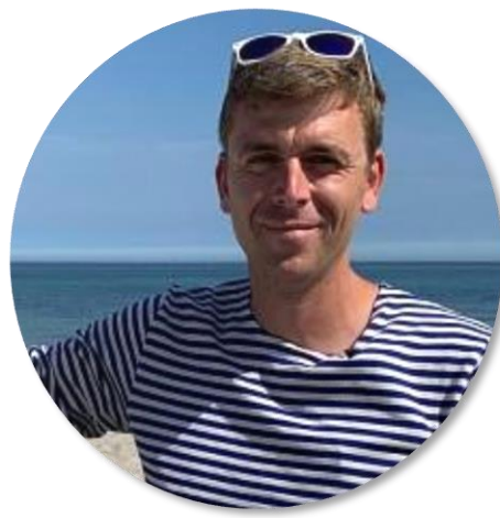
zpravodaj ČT v Německu