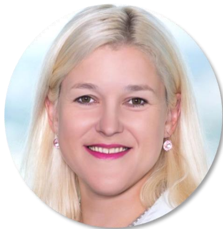
ředitelka Česko-izraelské smíšené obchodní komory