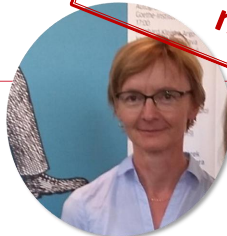
programová referentka Goethe Institutu