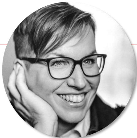
spisovatelka a překladatelka