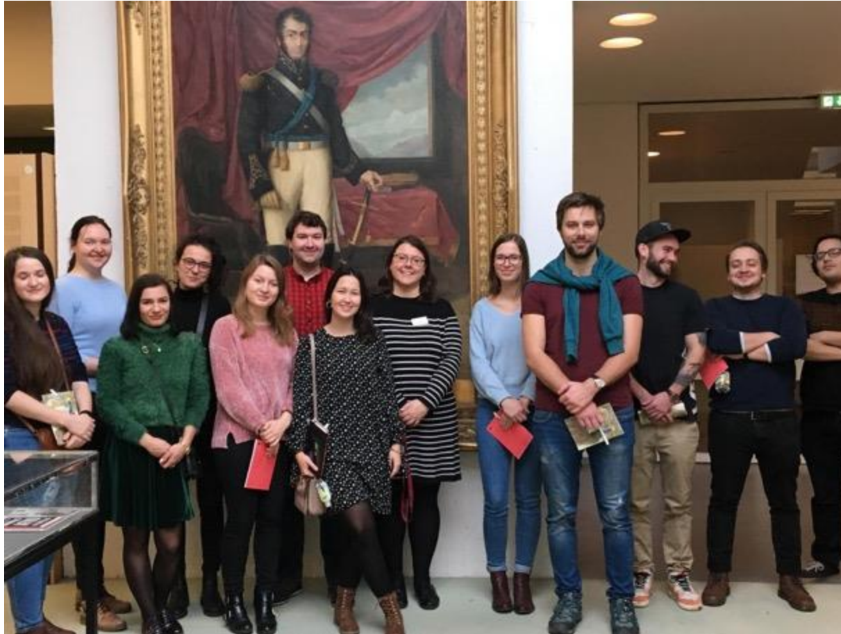
Návštěva Ibero-Amerikanisches Institutu v Berlíně, únor 2020